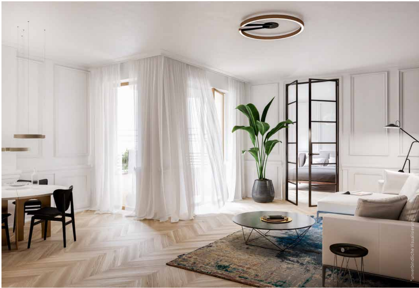
Wohn- und Essbereich